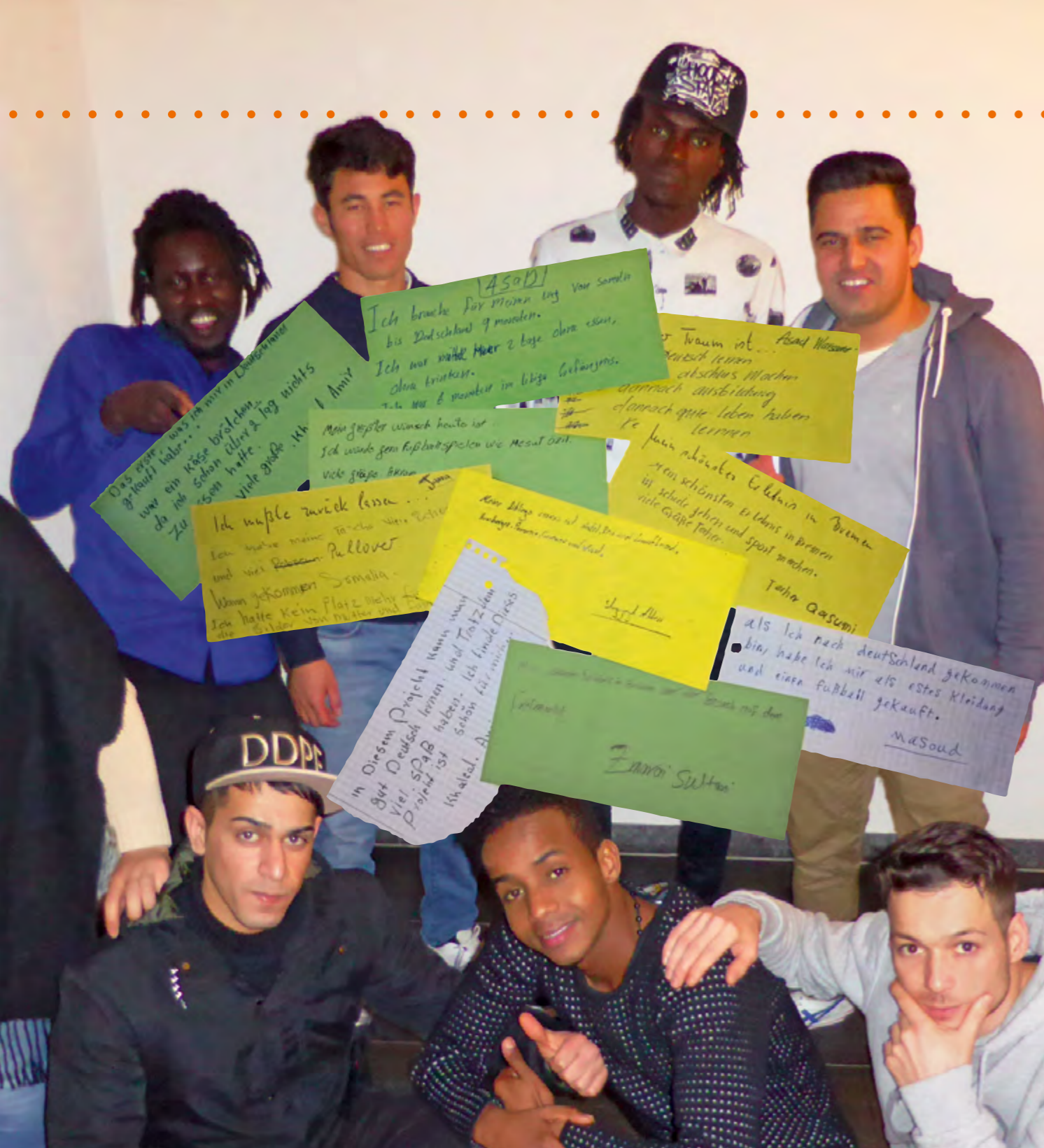
Schreibwerkstatt, siehe Artikel Seite 14/15.